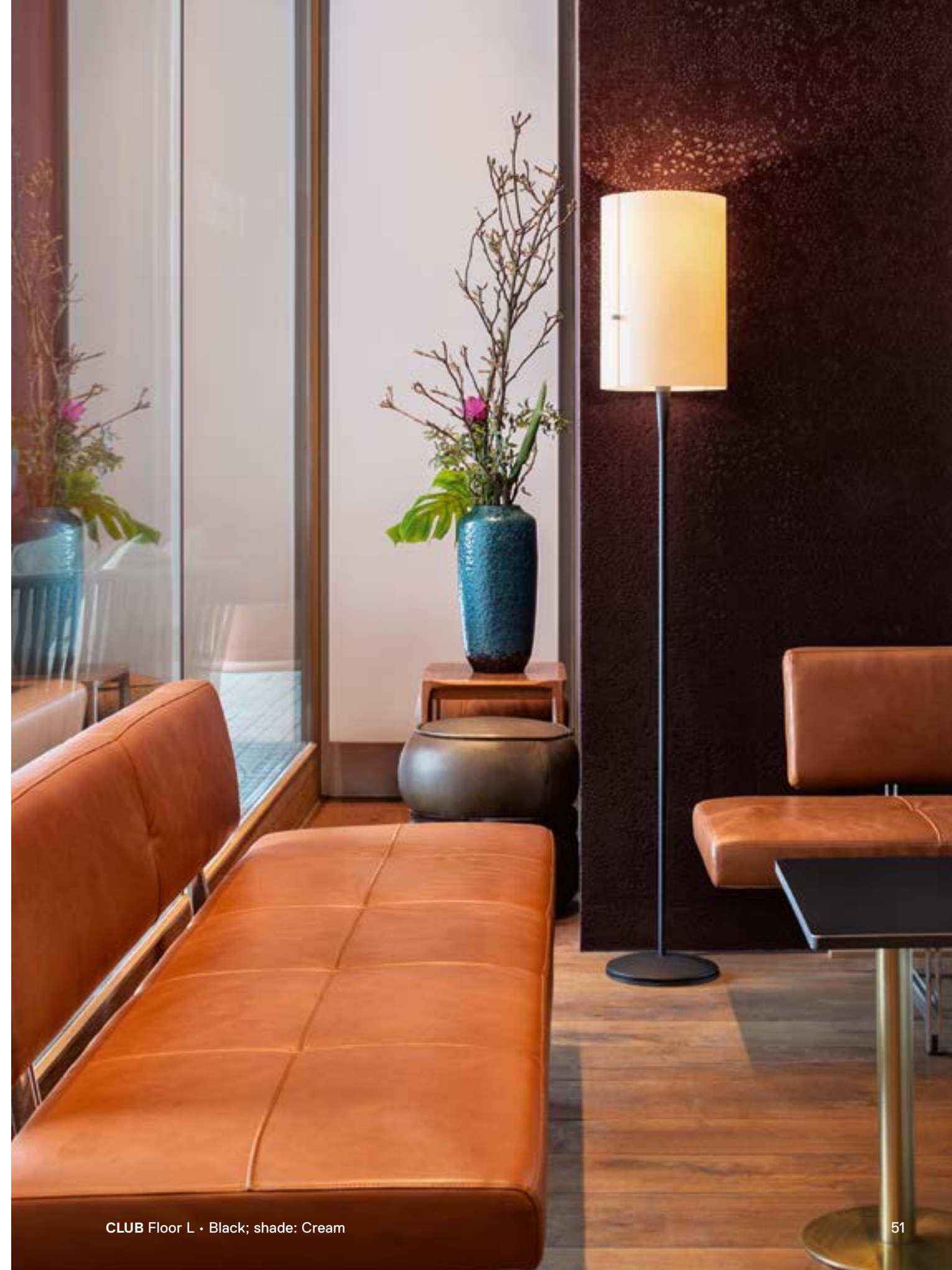
CLUB Floor L · Black; shade: Cream

With its reserved design, Club stands symbolically for the archetype of a luminaire category. The shade is made of textile laminated film, but intentionally does without the customary wiring. This prevents dark edges appearing when the shade is lit. Switched on, the luminaires create friendly, atmospheric light, which can be controlled by two knobs on the sides of the shade: one is for dimming, the other for switching Club on and off and controlling the direction of the light – the three-stage control switch enables users to switch on either just the two downwards-facing bulbs or simultaneously also the upwards-facing bulb as required. To the side the shade softly scatters the light. The floor and table luminaires are available in different shade sizes and all models come in various colors. The base of the floor and table luminaires comes with a cable winder.