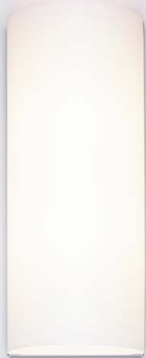
CLUB Wall • shade: White