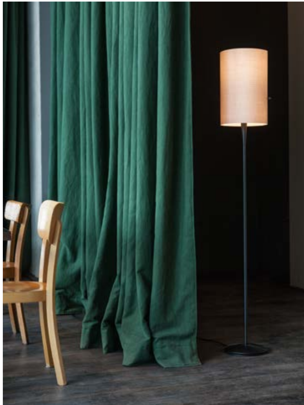
CLUB Floor L • Black; shade: Cream